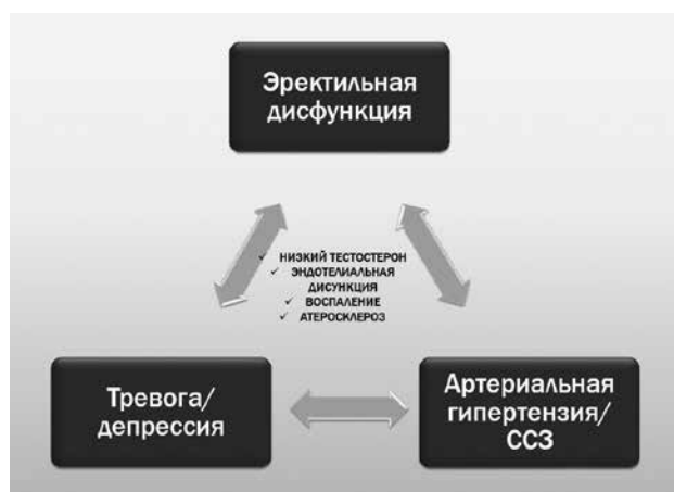
Рис. 1. Общие звенья — низкий тестостерон, эндотелиальная дисфункция, малопрогрессирующее системное сосудистое воспаление — в патогенезе эректильной дисфункции, тревоги / депрессии и артериальной гипертензии

Клинические исследования указывают на тесную связь ЭД с сердечно-сосудистыми заболеваниями [9]. По данным F.A. Giuliano и соавт. [10], ЭД выявляется почти у 70% мужчин с артериальной гипертензией, при этом тяжелая степень ЭД обнаруживается у 45,2% мужчин с АГ против 10% в общей популяции. С помощью доплерографии сосудов полового члена ЭД определяется у 87% гипертензивных пациентов [11]. Важнейшим патогенетическим звеном как гипертензии, так и ЭД является дисфункция эндотелия и недостаточная продукция оксида азота (NO) — основного модератора системного и органного кровотока. Повышенное артериальное давление, особенно на фоне старения, сопровождается нарушением эндотелий-зависимой вазодилатации с последующим структурным ремоделированием, развитием атеросклероза и стенозом кровеносных сосудов, обеспечивающих кровоток во время эрекции (рис. 1) [12, 13]. Утяжелению эндотелиальной дисфункции и возникновению ЭД способствует и хроническое сосудистое воспаление. Повышенные уровни маркеров и медиаторов воспаления (С-реактивный белок, молекула межклеточной адгезии 1 типа, интерлейкин 6 (IL-6), IL-10, IL-1 \beta , фактор некроза опухолей \alpha ) и эндотелиальных / протромботических факторов (фактор фон